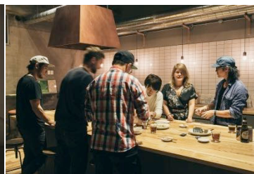
▲シェアキッチン（イメージ）