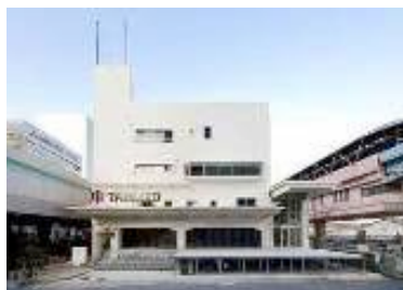
オフィス商業複合施設「TABLOID」 www.tabloid-tcd.com/