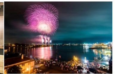
▲ルーフトップから眺める花火 （昨年開催された実際の写真）