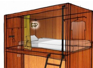
SHARED ROOMS イメージ