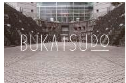
街のシェアスペース「BUKATSUDO」 bukatsu-do.jp