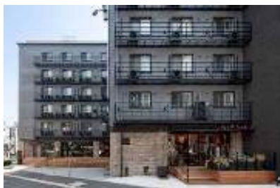
原宿神宮前「THE SHARE」 www.the-share.jp/

名称：株式会社リビタ 設立：2005年（2012年より京王グループ） 代表取締役社長：都村 智史 住所：東京都渋谷区渋谷 2-16-1 URL： www.rebita.co.jp