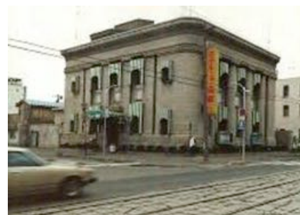
▲昭和44年開業当時のホテルニューハコダテ