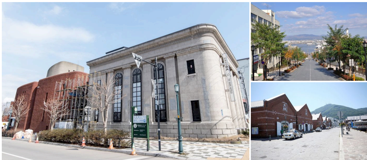
▲左：ホテル外観 右上：名所八幡坂に面した立地 右下：近隣には赤レンガ倉庫群が立ち並ぶ

公式ウェブサイト http://www.thesharehotels.com/hakoba